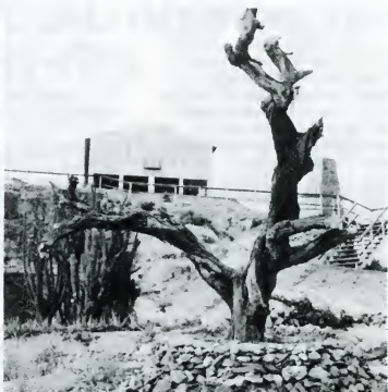
Edifisio di Gold Mill Paradise

ñor Bikker a contestá cu sigur nan ta mira como parti di nan tarea pa vigilá konstrukshonnan nobo y protestá caminda esaki ta nesario. Pero, MZ no tin ningun derecho legal pa interviní den ningun proyecto. Ni sikiera nan tin "inzage" den loke ta drenta na proyecto nobo.